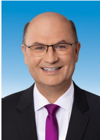
Albert Füracker, MdB Bayerischer Staatsminister der Finanzen und für Heimat