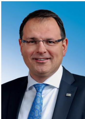
Martin Schöffel, MdB Staatssekretär im Bayerischen Staatsministerium der Finanzen und für Heimat