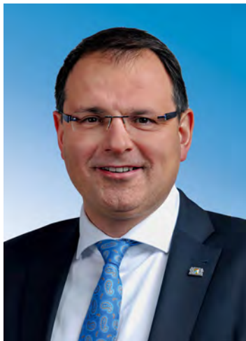
Martin Schöffel, MdB Staatssekretär im Bayerischen Staatsministerium der Finanzen und für Heimat